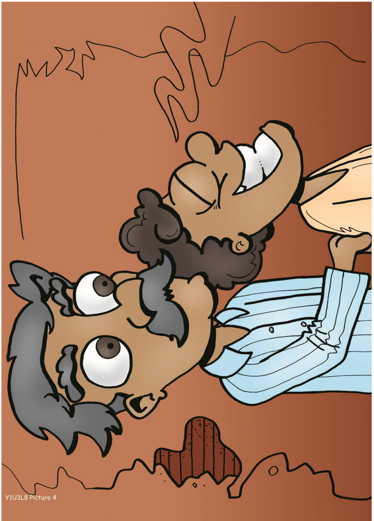
Y1U3L8 Picture 4